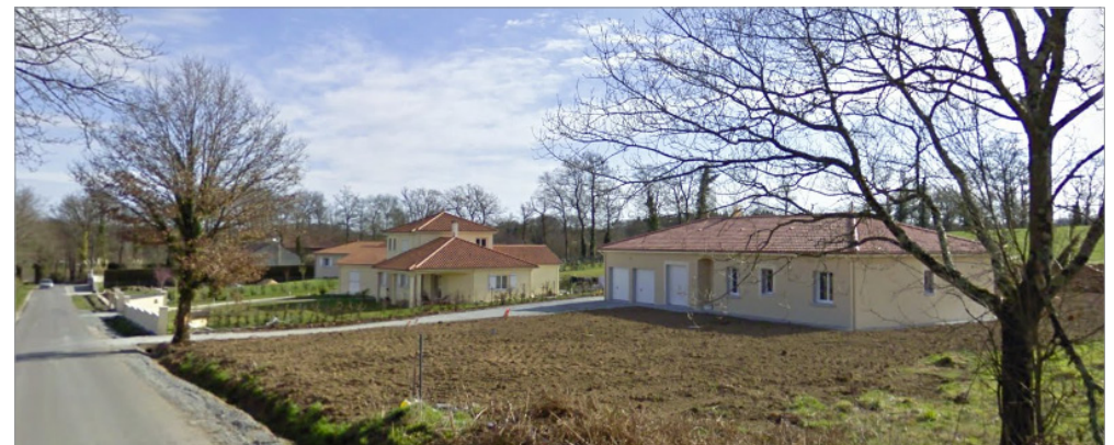
Exemple de développement linéaire