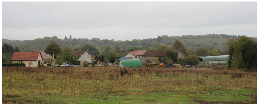
Vulnérabilité du paysage