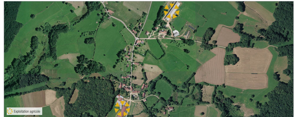
Exploitations agricoles Virareix